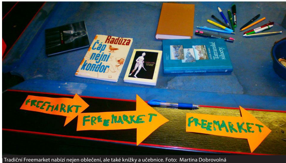
Tradiční Freemarket nabízí nejen oblečení, ale také knížky a učebnice.