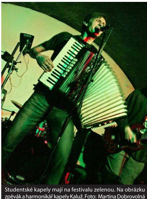
Studentské kapely mají na festivalu zelenou. Na obrázku zpěvák a harmonikář kapely Kaluž.

Festival podporuje katedra sociologie a také občanské sdružení Sociologické nástupiště, pod které spadá většina studentských aktivit spojená s katedrou. Lefrvesáns totiž není jedinou aktivitou mladých brněnských sociologů. Pod křídly Sociologického nástupiště se koná také každoroční večerek katedry sociologie Sockap, studentská konference nanečisto s názvem Sociologie zítřka, cyklus promítání a diskusí Sociologie a film, integrační pobyty studentů prvního ročníku a sociologické exkurze či diskuze nad vybranými tématy.