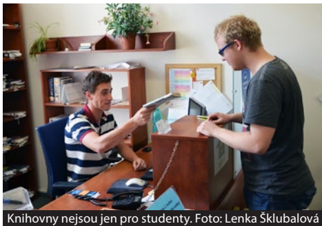
Knihovny nejsou jen pro studenty.

Stačí si pořídit kartu absolventa a ani po promoci se bývalí studenti Masarykovy univerzity nemusí vzdávat návštěv fakultních knihoven. Díky kartě navíc mohou získat i různé slevy, například na jazykové kurzy, mohou si také levněji než jiní v případě potřeby pronajmout některé z univerzitních prostor.