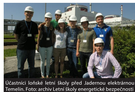
Účastníci loňské letní školy před Jadernou elektrárnou Temelín.

Mezinárodní letní školu Atlantic and Continental Approaches to Energy Security, na níž budou přednášet světové špičky z oboru, připravuje katedra mezinárodních vztahů a evropských studií. Letní škola má studentům poskytnout možnost srovnání energetické politiky Spojených států a evropských zemí z různých úhlů pohledu. Akce se uskuteční od 3. do 10. srpna v Univerzitním centru Masarykovy univerzity v Telči.