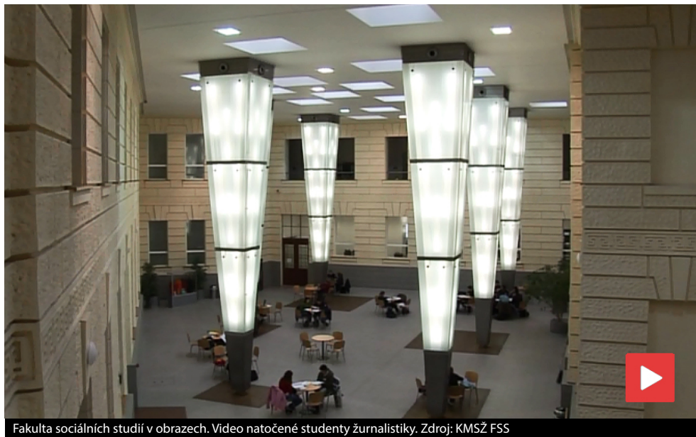
Fakulta sociálních studií v obrazech. Video natočené studenty žurnalistiky.

Různorodá a dynamická fakulta s přátelským prostředím, kde si každý najde to své. Studium na vysoké úrovni, úspěšní absolventi, kteří se v praxi neztratí. Taková je Fakulta sociálních studií Masarykovy univerzity ve svých patnácti letech, které slaví právě letos.