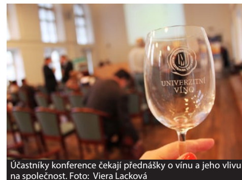
Účastníci konference čekají přednášky o vínu a jeho vlivu na společnost.

Zajímavá akce čeká v podzimním semestru milovníky vína. Na konferenci Člověk, víno, společnost, která se uskuteční 21. listopadu, si budou moci vyslechnout přednášky o vínu a jeho vlivu na společnost. Už šestý ročník této konference se bude konat v prostorách fakulty sociálních studií a celá akce se ponese v odlehčeném, přesto akademicky seriózním duchu.