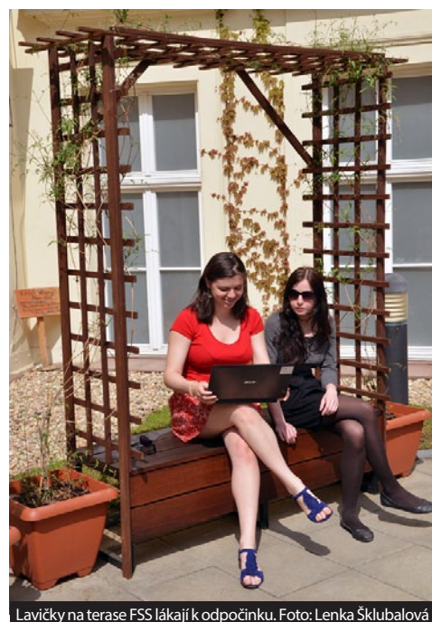
Lavičky na terase FSS lákají k odpočinku.

Místo toho mají české vysoké školy mnoho absolventů, kteří dělají to, co je baví, netrpí syndromem vyhoření a vydělávají pár tisíc měsíčně. Sociální pracovníci, novináři a sociologové těžko mohou škole přispět větší sumou, koupit zbrusu nové dataprojektory nebo nechat vystavět výukový pavilon. Škola tak musí hledat alternativní řešení. Drobným příkladem