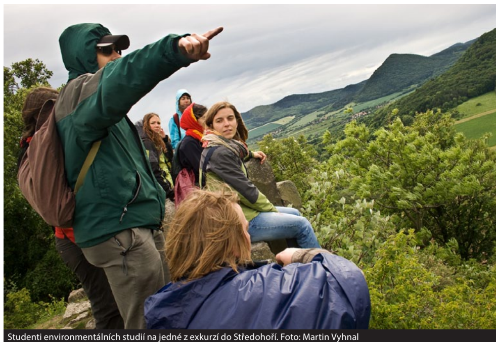
Studenti environmentálních studií na jedné z exkurzí do Středohoří.

Studenti fakulty sociálních studií nepitvají jako medici, neposlouchají soudní jednání jako budoucí právníci, ani nepraktikují na školách jako studenti pedagogické fakulty. Přesto je jejich výuka praktická mnohem víc, než se zdá.