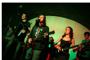
Sociologie festivalově > s. 5