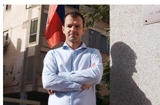
Absolvent v Tel Avivu > s. 2