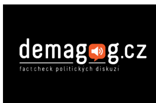
Studenti hlídají politiky > s. 3